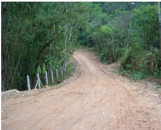
Rua Valentino Redivo – vista do entroncamento com a Rua Julio Prestes de Albuquerque

A Rua Valentino Redivo recebeu melhorias e está transitável, sem buracos que impeçam ou dificultem de sobremaneira o tráfego. A barreira que atingiu o entroncamento com a Rua Julio Prestes de Albuquerque e acesso à Estrada do Soma foi retirada.