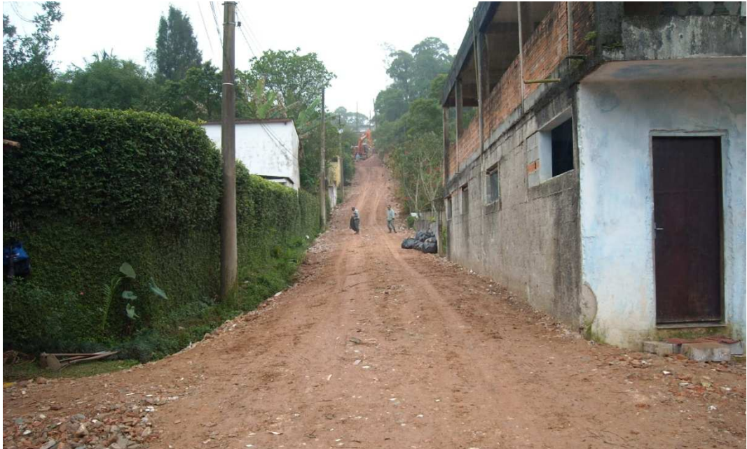
Rua Nelço Izidoro Ferreira – vista a partir da Rua Terezinha Arnoni Castelucci (sacos de lixo à direita)

A Rua Nelço Izidoro Ferreira está recebendo melhorias. No momento da inspeção foram observados homens trabalhando e uma máquina no local. Merece destaque o fato de que a Prefeitura insiste em despejar no solo materiais não inertes. No momento da vistoria, percebeu-se que agentes do Município estavam tentando retirar do solo os materiais não inertes que estavam pela superfície, os quais foram colocados em sacos de lixo preto para posterior retirada. A medida não é suficiente para o fim suposto a que se destina. A reciclagem do entulho deveria ser feita antes da colocação no solo.