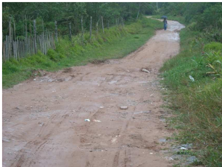
Rua Dois – vista a partir da entrada para a Rua Cinco em direção à Teresinha Arnoni Castelucci

Para acessar a Rua Um onde há concentração de casas, foi preciso prosseguir pela Rua Dois até a trilha que dá acesso a ela. De todas as ruas visitadas, a Rua Dois é a com mais buracos e de mais difícil trânsito, chegando a ser impossível seu acesso de carro, após a saída para as Ruas Cinco e Quatro.