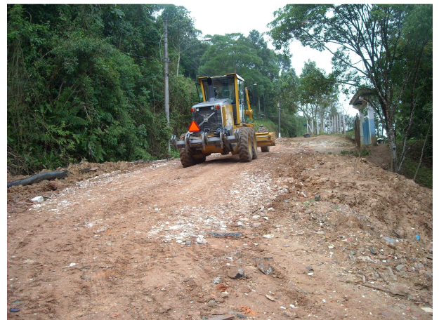
Rua Julio Prestes de Albuquerque – vista do entroncamento com a Rua Valentino Redivo