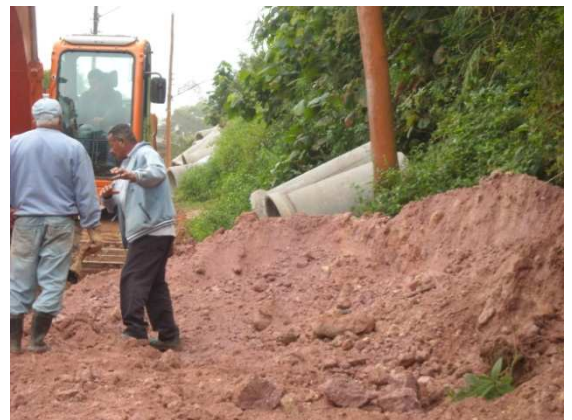
Máquinas e homens trabalhando