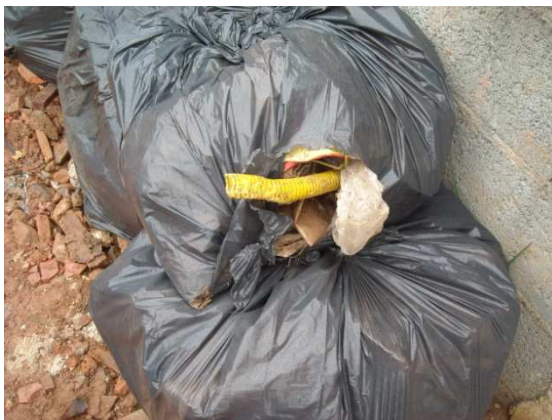
Sacos de lixo contendo conduíte (entulho)