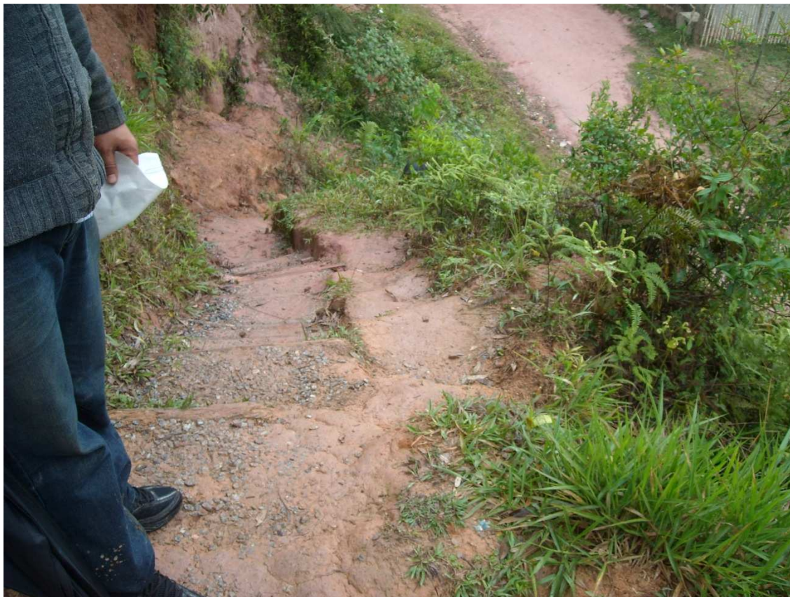
Trilha vista de cima, de quem desce da Rua Um para a Rua Dois