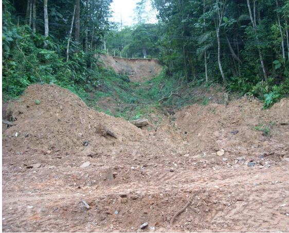
Vista do barranco que havia desmoronado