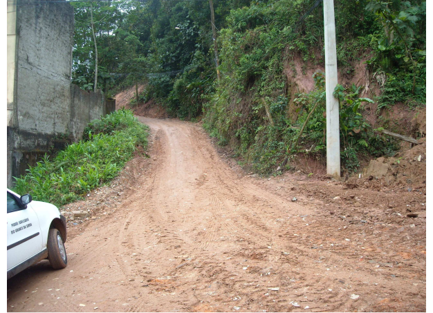
Acesso à Estrada do Soma – vista do entroncamento das Ruas Valentino Redivo e Julio Prestes de Albuquerque

A Rua Cinco teve os buracos da porção central tapados – altura do nº 125. A informação da senhora oficial de justiça, por ocasião da diligência de constatação, no sentido de que a obra teria sido promovida pelos moradores, pode ser confirmada diretamente com o Secretário de Serviços Urbanos. Além disto, a qualidade de materiais utilizados (telhas) é diferente da de origem da Prefeitura.