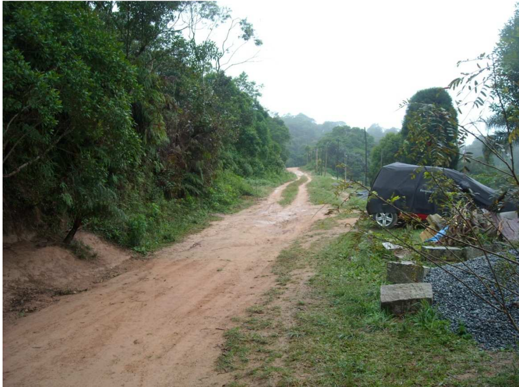
Rua Um à esquerda de quem sai da trilha

A Rua Valentino Redivo recebeu melhorias e está transitável, sem buracos que impeçam ou dificultem de sobremaneira o tráfego. A barreira que atingiu o entroncamento com a Rua Julio Prestes de Albuquerque e acesso à Estrada do Soma foi retirada.