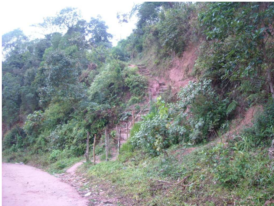
Trilha vista da Rua Dois para a Rua Um – vista ampla, destinada a mostrar a acividade do terreno