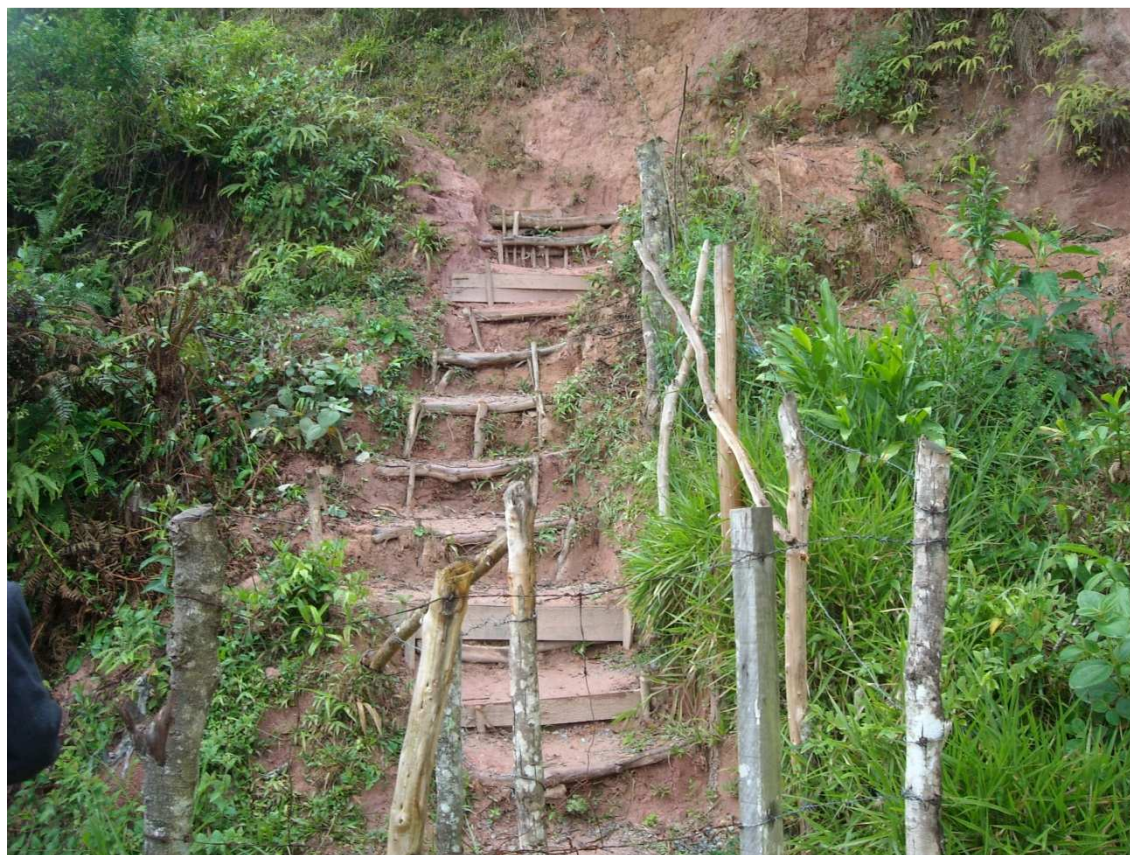
Trilha em vista aproximada – precariedade e improvisação nos degraus da escadaria