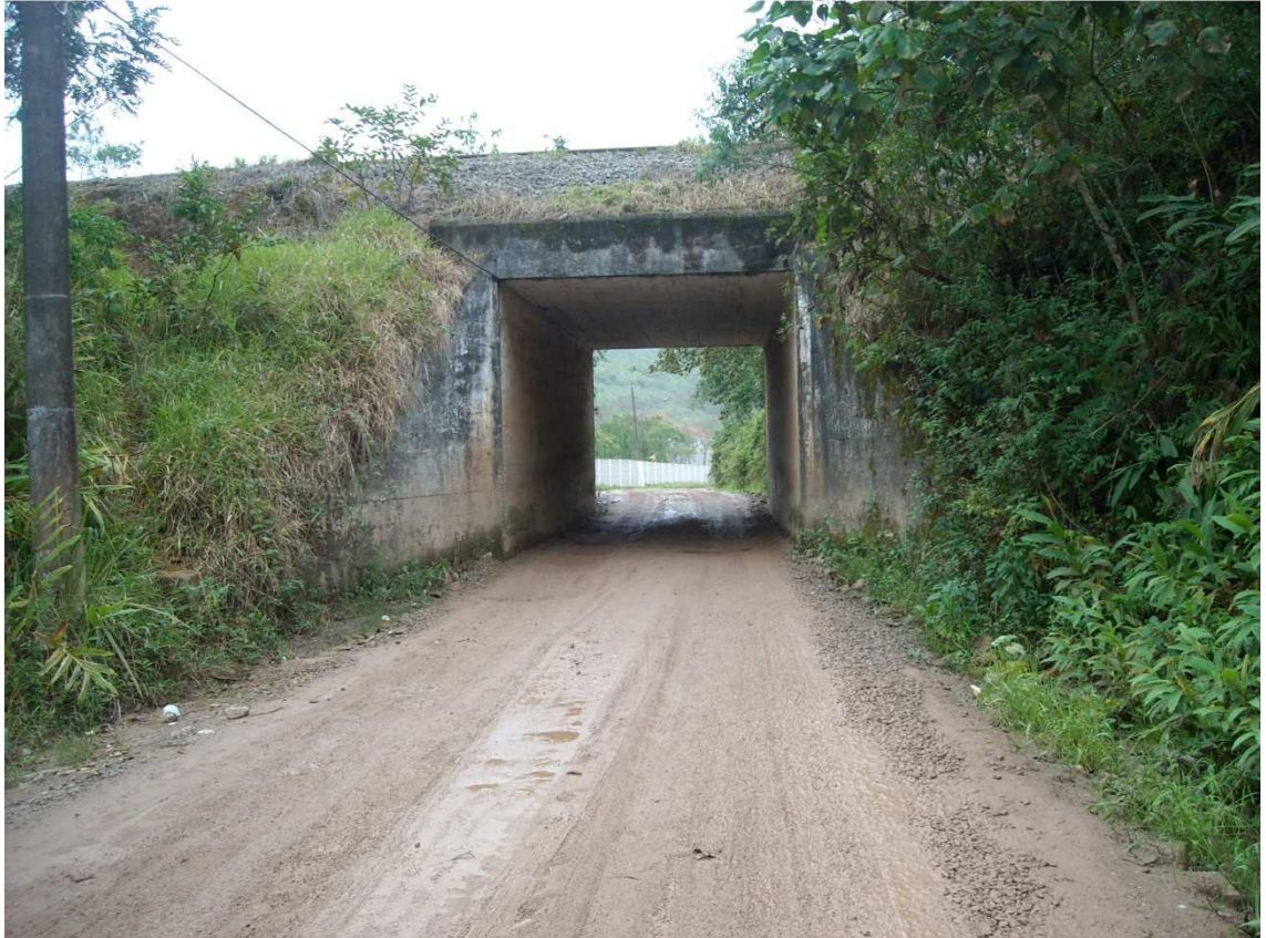
Rua Terezinha Arnoni Castelucci – trecho sob a linha férrea – sentido Rua Nelço Izidoro Ferreira

A Rua Terezinha Arnoni Castelucci teve seu leito carroçável melhorado, mas continua sem pavimentação. Na parte abaixo da linha férrea, houve melhorias, mas ainda existem buracos. Percebe-se que a porção central, onde não existe contato direto com pneus, a conservação é melhor. Já as porções direita e esquerda estão afundando em alguns pontos, mostrando a fragilidade da obra.