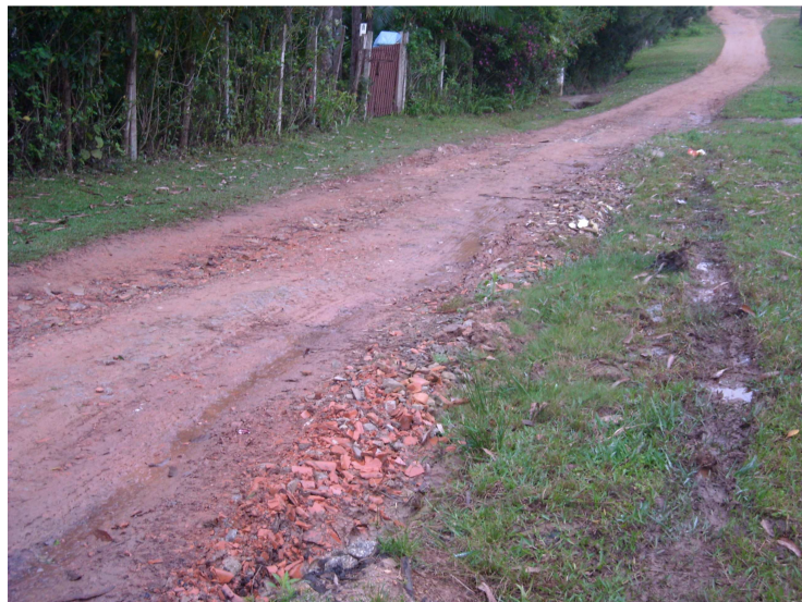
Rua Cinco, na altura do nº 125 – detalhe das telhas utilizadas

A Rua Cinco teve os buracos da porção central tapados – altura do nº 125. A informação da senhora oficial de justiça, por ocasião da diligência de constatação, no sentido de que a obra teria sido promovida pelos moradores, pode ser confirmada diretamente com o Secretário de Serviços Urbanos. Além disto, a qualidade de materiais utilizados (telhas) é diferente da de origem da Prefeitura.