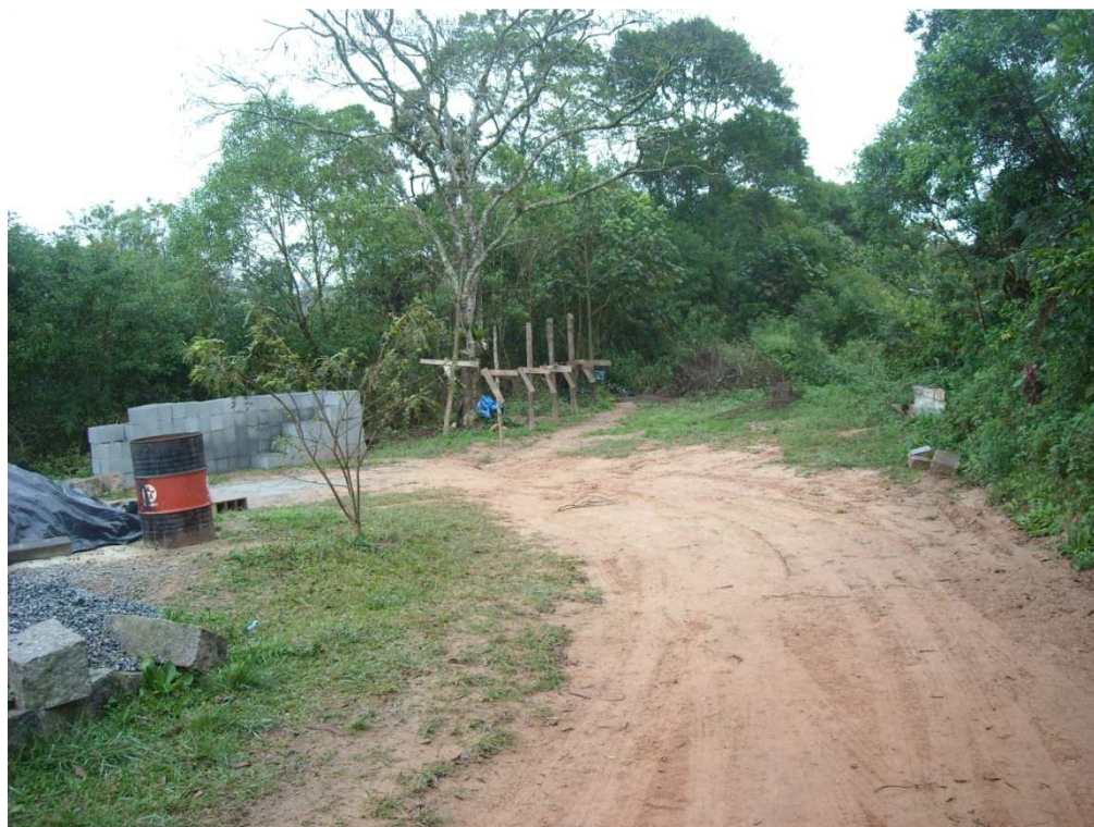
Rua Um à direita de quem sai da trilha