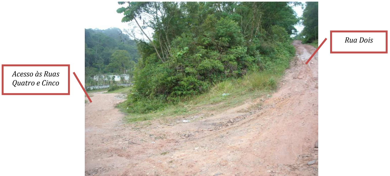
Vista da Rua Dois, no sentido de quem vem da Rua Terezinha Arnoni Castelluci